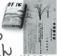
「卒塔婆小町」初出雑誌及び書き出し