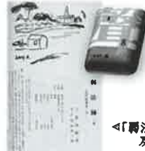
「弱法師」初出雑誌及び書き出し

近代能楽集 (新潮社、昭和 31・4) 古典芸能である能を三島が現代化したもの。時代をこえて人間の普遍的な部分を表現している作品集である。「卒塔婆小町」、「弱法師」含む全 8 作を収録。 現在、新潮文庫より発売中。