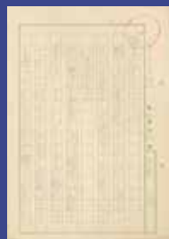
作文「梅見に友をさそふ」 1935(昭和10)年2月12日 初等科4年の頃の作文。

幼少期は祖母の元で育てられ、彼の作品には、その影響を読み取ることができる。子供の頃から作文や詩、短歌や俳句などの文学活動に励んでいた。