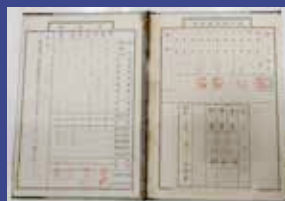
通信簿 1933(昭和8)年4月～1934(昭和9)年3月 初等科3年の通信簿。