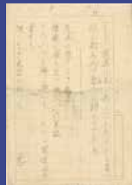
作文「卒業」 1937(昭和12)年3月頃 初等科卒業に向けて三島が書いた作文。