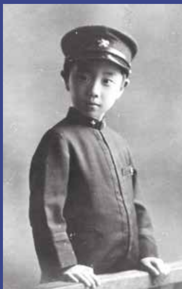
学習院初等科入学の頃（昭和6年）