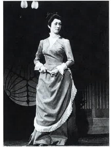
「鹿鳴館」朝子 昭和42年（1967）